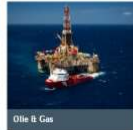
Olie & Gas