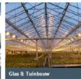
Glas & Tuinbouw